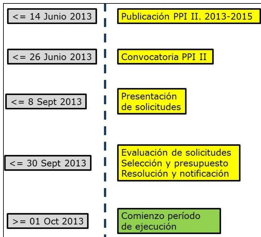
Ilustración 1. Calendario previo a período de ejecución

5.4. El plazo para la presentación de las solicitudes finalizará el 8 de Septiembre de 2013. El plazo de evaluación, selección y notificación finalizará el 30 de Septiembre de 2013. El período de investigación comenzará a partir del 1 de Octubre de 2013. Los informes periódicos se presentarán acorde con calendario que será publicado posteriormente